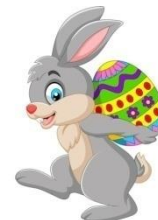
An Easter bunny