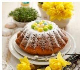
An Easter cupcake