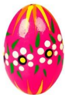
An Easter egg